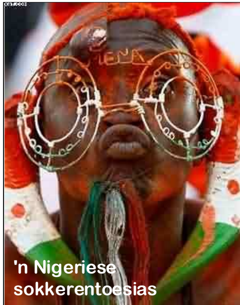
'n Nigeriese sokkerentoesias