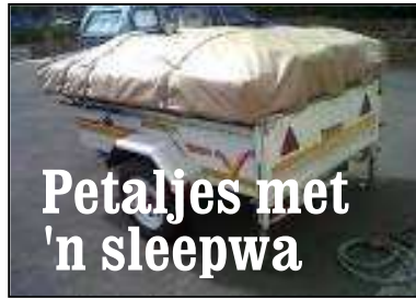
Petaljes met 'n sleepwa

'Die sak klink mos soos my sak'. Ons sal moet terugdraai en duimvashou dat die sak nog daar lê, want dit is winter en ons kan nie kampeer sonder komberse nie. Al kombers wat nou nog in die kar is, is die hond s'n.